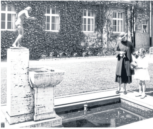
Brunnenanlage im Innenhof des Bäderhauses mit der „Wasserträgerin“ von Ludwig Cauer, Mitte der 30er-Jahre.