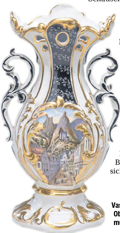
Vase mit Ansicht Obersteins, Landesmuseum Oldenburg