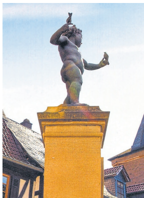
Ausschnitt aus dem vorderen Umschlagbild.