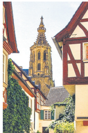
Ausschnitt aus dem hinteren Umschlagbild.

Auf den Seiten 70 bis 85 werden, ausgehend vom spätgotischen Juwel der Schlosskirche, in Bild und Text 25 sehenswerte und historisch interessante Gebäude Meisenheims vorgestellt und einem „Historischen Stadtrundgang“ zugeordnet. Ihre Lage ist anhand einer klar gestalteten „Übersichtskarte“ (S. 86/87) gut zu ermitteln, so dass sich der Rundgang leicht nachvollziehen lässt. Dem Panorama-Weg, der sich oberhalb des rechten Glanufers durch den Stadtwald zieht und immer wieder großartige Ausblicke auf Meisenheim eröffnet, ist eine eigene Doppelseite (S. 88/89) gewidmet. Die textlichen Erläuterungen zu den Meisen-