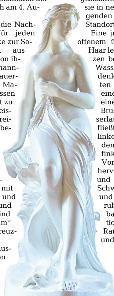
„Undine“ von Robert Cauer d.Ä. im Schloßparkmuseum Bad Kreuznach.

Eine junge Frau, eine Nymphe, mit offenem über den Rücken fließendem Haar lehnt locker an einem von Pflanzen bewachsenen Felsen über dem Wasser (das man sich hier dazu denken muss). Ihren unbekleideten Körper bedeckt sie leicht mit einem Tuch, das die linke Hand in einem Bausch vor der rechten Brust fasst und das wie ein Wasserlauf über ihre Beine abwärts fließt. Den Kopf dreht sie über die linke Schulter seitwärts und lässt den rechten Fuß auf einem Delphinkopf ruhen, der nach antikem Vorbild mit breitem Maul und hervortretenden Augen gebildet ist und seinen Leib mit elegantem Schwung erhebt. Dieses Natur- und Mythenwesen herrscht mit ruhiger Umsicht über die kostbare Quelle, deren Personifikation sie verkörpert. Im umbauten Raum der technisch gefassten und erforschten Quellen erinnert